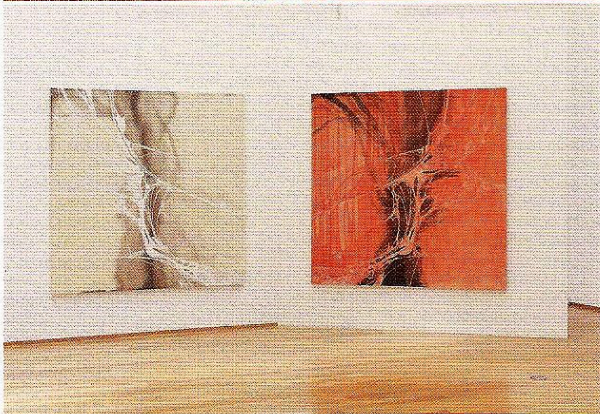
C - 繊維 2009年 / 紙に胡粉、膠、骨、ポリウレタン / 各170x170 cm

常日頃、何かにつけてインターネットで検索してしまう。あの作家、何年生まれだっけ?あそこのギャラリー、いま何を展示してるんだっけ?ネット依存症のあまり、交通費や時間をかけて展覧会をまわる人も減っているのではないだろうか。